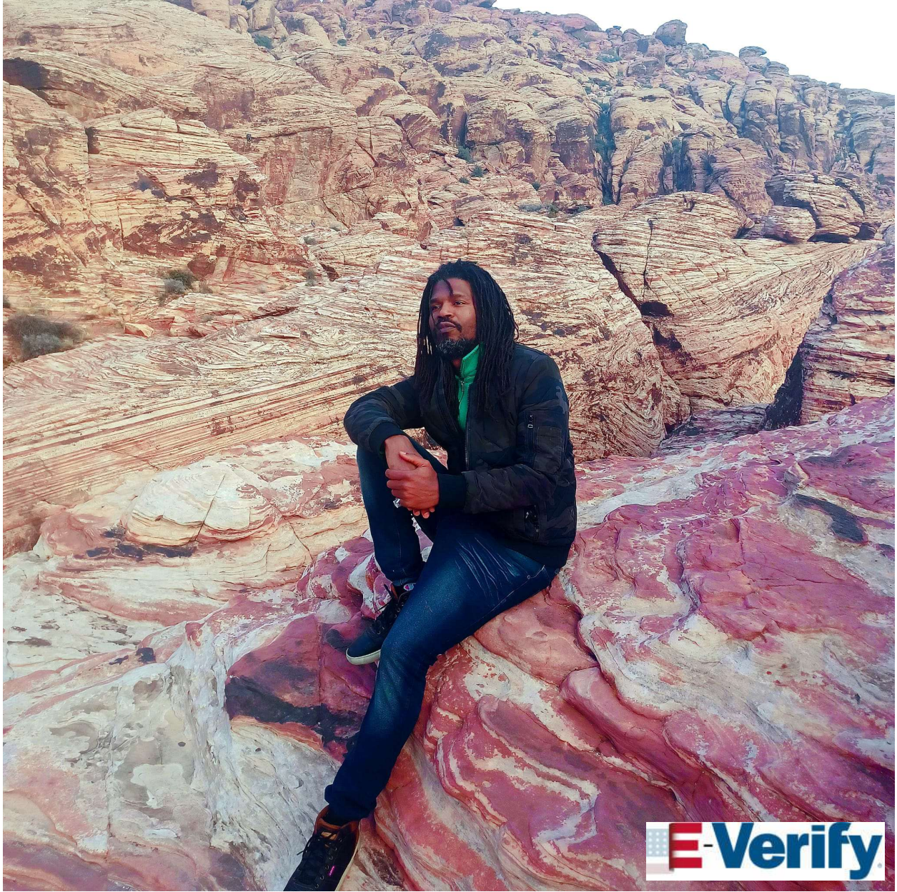
ደራሲ, Haile Frasier Selassie